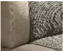
+ Wohnwelt Camino