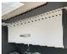
+ Möbeldekor Amberes Oak ○