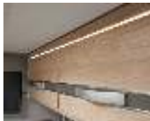
+ Möbeldekor Noce Nagano, Absatzdekor Web Kieselgrau