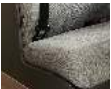
+ Wohnwelt Scandi